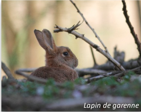
Lapin de garenne