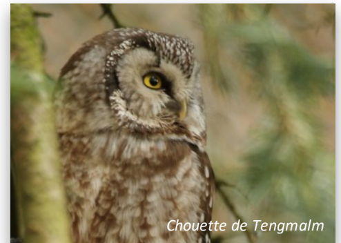
Chouette de Tengmalm

Cette petite chouette est présente dans les Ardennes mais son aire de répartition reste mal connue du fait de ces faibles effectifs et d'une importante surface à prospecter. Le ReNARD effectue des recherches spécifiques de mars à avril et sollicite l'aide de volontaires pour lui prêter main forte. Afin de limiter au maximum le dérangement, il est nettement préférable que les prospections soient organisées. Pour participer, vous pouvez contacter le bureau du ReNARD par téléphone 03.24.33.54.23 ou par mail bureau.renard@orange.fr . Avis aux amateurs !