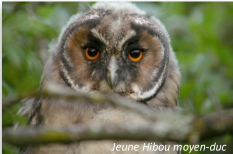
Jeune Hibou moyen-duc

Venez découvrir, le 7/04 , les rapaces nocturnes à travers un diaporama, puis partez à leur recherche, avec le ReNArD en partenariat avec le PNR des Ardennes. Rdv à 19h, place de la salle polyvalente de Vaux-Vilaine (08). Durée : environ 2h30. Inscription obligatoire (PNR : 03.24.42.90.57). Gratuit. Tout public.