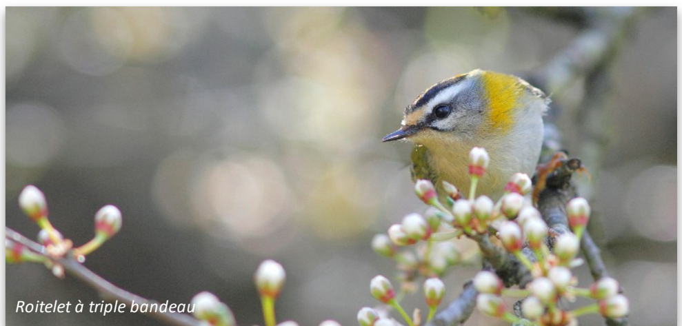
Roitelet à triple bandeau

Les Rougequeues noirs (RQN) font leur grand retour en région. Certains mâles ont déjà réinvesti leurs sites de reproduction et chantent à tue-tête du haut de leur perchoir pour attirer une femelle et chasser d'éventuels mâles rivaux. Si tout le monde sait reconnaître le mâle adulte de RQN, cela se complique pour les jeunes et les femelles, mais vous pouvez vous aider du document avec ce lien pour l'identification. Pour en savoir plus pour la saisie dans FCA, cliquez sur ce lien .