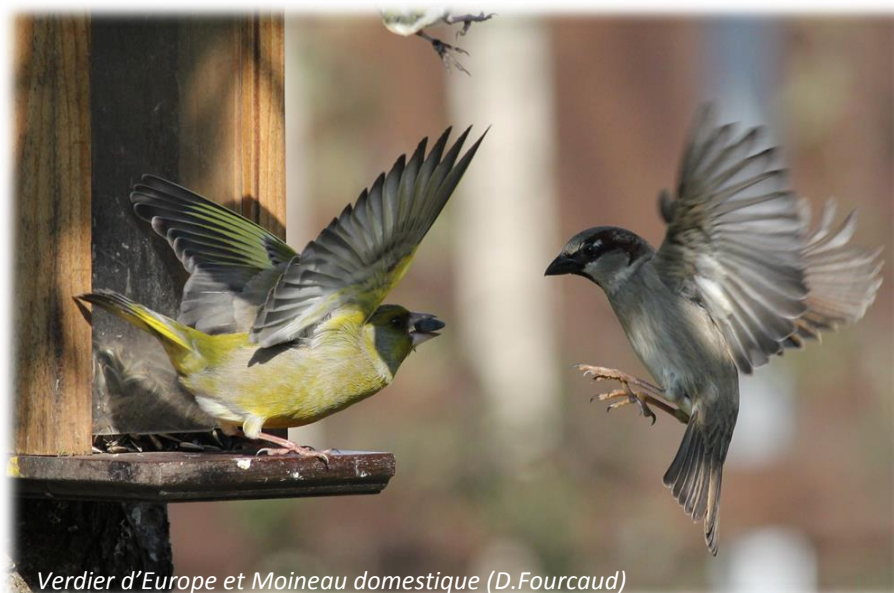
Verdier d'Europe et Moineau domestique

En espérant vous retrouver l'année prochaine, mais aussi et avant cela, pour le comptage printanier des 28 et 29 mai 2016. N'oubliez pas que vous pouvez saisir les observations de faune de votre jardin mais aussi partout ailleurs dans la région et ce, à tout moment. Merci encore et à très bientôt sur Faune-Champagne-Ardenne!