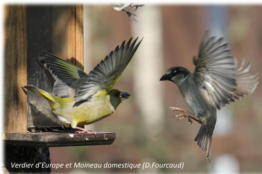
Verdier d'Europe et Moineau domestique (D.Fourcaud)

En espérant vous retrouver l'année prochaine, mais aussi et avant cela, pour le comptage printanier des 30 et 31 mai 2015. N'oubliez pas que vous pouvez saisir les observations de votre jardin mais aussi partout ailleurs dans la région et ce, à tout moment. Merci encore et à très bientôt sur Faune-Champagne-Ardenne!