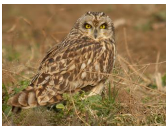
Hibou des marais

Depuis plus de 20 ans et tous les deux ans, la grande famille des rapaces nocturnes, chouettes et hiboux, est fêtée sur l'ensemble du territoire français, et même à l'étranger (Belgique, Luxembourg...).