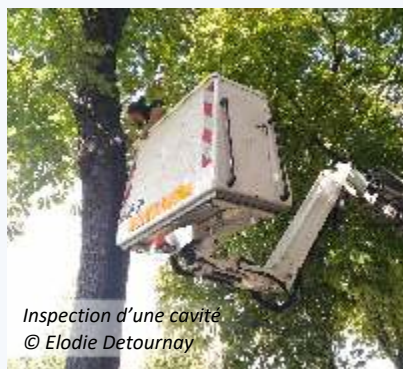
Inspection d'une cavité

Dans un premier temps, la ville a effectué les démarches nécessaires auprès de la DREAL Grand Est pour se doter d'un arrêté : cette dérogation est indispensable pour les collectivités souhaitant agir dans un cadre réglementaire. En amont des travaux, un important travail de coordination entre les services de la ville, les intervenants, les entreprises et la LPO a été nécessaire à la conduite de cette opération.