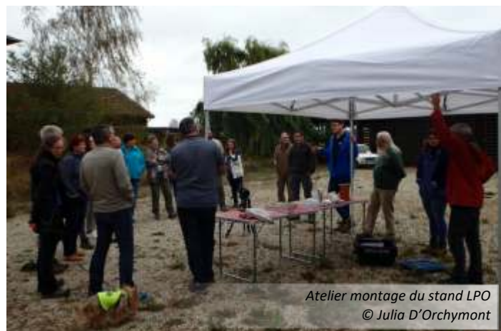
Atelier montage du stand LPO

des levers et couchers de grues, des journées der, mais aussi lors des trains aux oiseaux et pour la tenue de l'exposition photo.