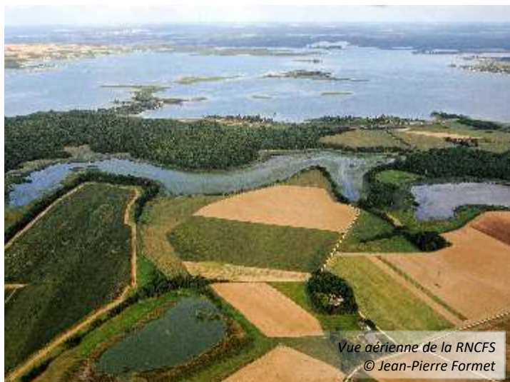
Vue aérienne de la RNCFS

Fort de l'expérience acquise sur ces deux premiers étangs, l'équipe est parée pour la phase finale du cycle d'assec qui se terminera en 2019 par l'étang de la Forêt, le dernier de la série (ne le cherchez pas, il est interdit au public !).