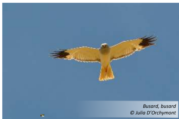
Busard, busard

Merci aux Busardeux aguerris que nous avons rencontrés ou contactés, pour leurs nombreux conseils et leur soutien.