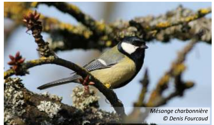
Mésange charbonnière

La mobilisation est toujours plus forte dans la Marne (109 jardins), quasi-identique entre la Haute-Marne et l'Aube (respectivement 62 et 61 jardins) tandis que le département des Ardennes affiche 47 jardins participants.