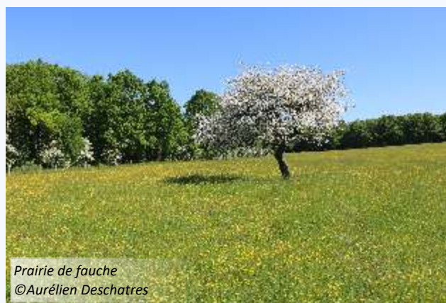
Prairie de fauche

Ce projet s'inscrit dans un Appel à Manifestation d'Intérêt (AMI) porté par la région Grand Est, la DREAL Grand Est ainsi que les agences de l'eau Seine Normandie, Rhin-Meuse et Rhône Méditerranée Corse.