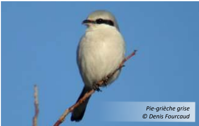
Pie-grièche grise

-Les recherches réalisées cette année montrent une nette raréfaction de la Pie-grièche à tête rousse en Champagne-Ardenne. Seuls 8 cantons ont ainsi été trouvés contre 41 en 2009 et 2010. Le bastion de l'espèce en Champagne-Ardenne se trouve dans le Bassigny, au sud-est du département de la Haute-Marne.