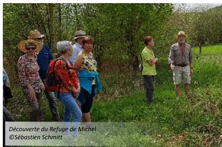
Découverte du Refuge de Michel © Sébastien Schmitt

Lien associatif: une adresse mail glchaumont52lpo@gmail.com permet la correspondance et la diffusion d'informations au sein du groupe et avec le siège régional; son adresse, diffusée régulièrement dans la presse et lors de chaque événement, nous permet également d'être contactés par le grand public.