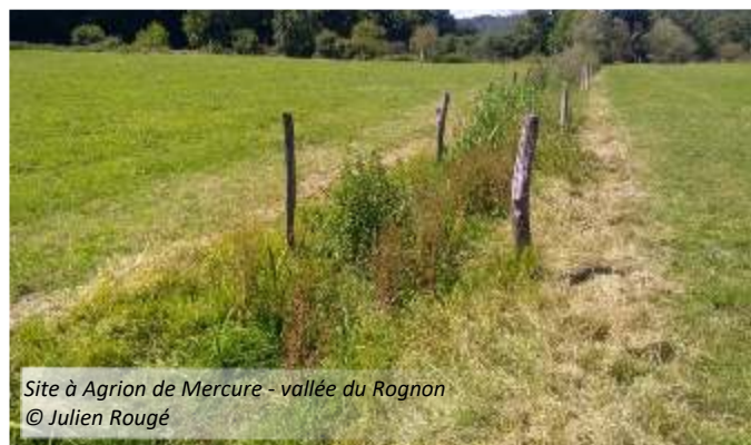
Site à Agrion de Mercure - vallée du Rognon

L'objectif était double : évaluer le potentiel d'accueil pour des espèces de libellules en prospectant les cours d'eau et les plans d'eau, mais également rechercher