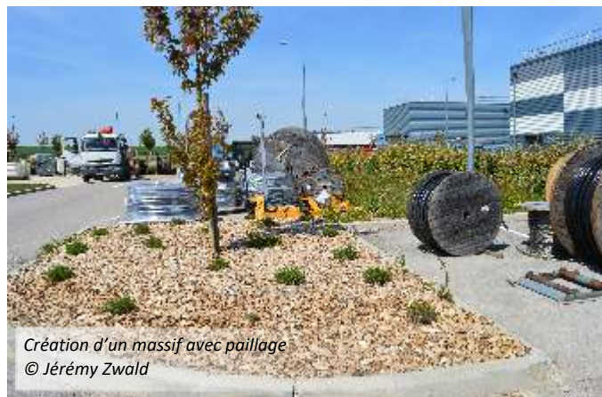
Création d'un massif avec paillage

Inscrit au programme des Refuges depuis 2014, le Refuge LPO « Les Jardins de Saint-Charles », situé au siège social d'Enedis de Reims, a subi d'importants travaux avec la création de nouveaux bureaux et la démolition des anciens. Modifiant la physionomie du site, la LPO a accompagné l'entreprise pour rendre le site accueillant pour la biodiversité, avec notamment l'installation de nichoirs à Faucon crécerelle, à mésanges, à Moineau domestique et à Choucas des tours.