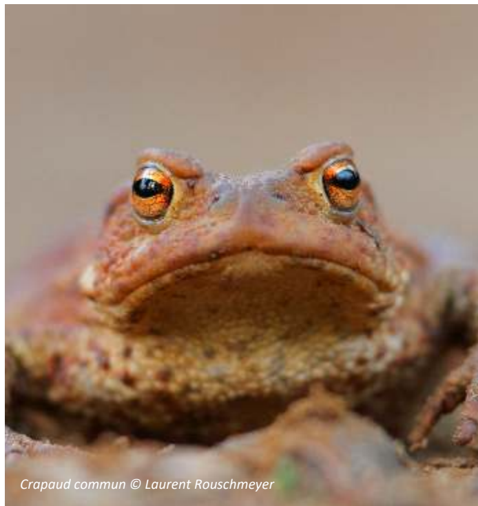
Crapaud commun

Chardonneret élégant; Bocage de Rives Dervoises - Louze.