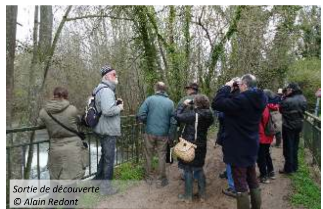
Sortie de découverte

Réunions biodiversité avec le Grand Reims.