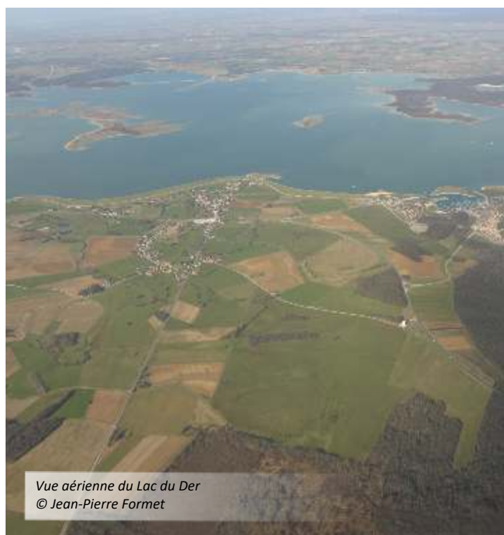
Vue aérienne du Lac du Der