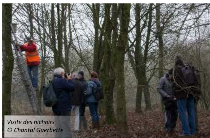
Visite des nichoirs

Et les actions de conservation ne manquent pas : suivi de nichoirs à Martinets noirs, installation de nichoirs à Effraies des clochers à Recy, installation de nichoirs à Faucons crécerelles à Esternay, nettoyage des nichoirs installés dans les parcs urbains de l'agglomération, suivi d'une mesure compensatoire pour Hirondelles de fenêtre dans le quartier Saint-Pierre, suivi des dortoirs hivernaux à Hiboux moyen-duc dans le quartier du Verbeau.