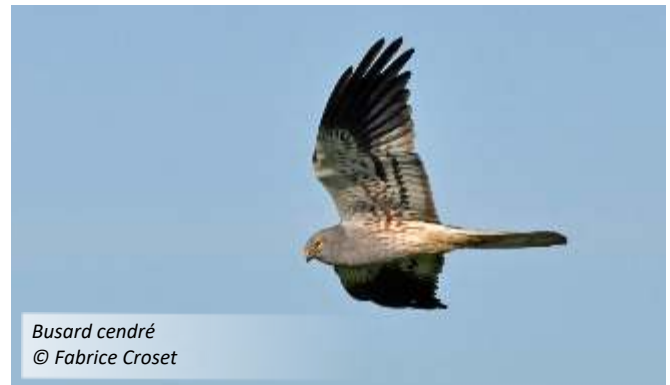
Busard cendré

Des mesures devront être prises pour que la « biodiversité » de nos plaines agricoles cesse de disparaître. Que faire ?