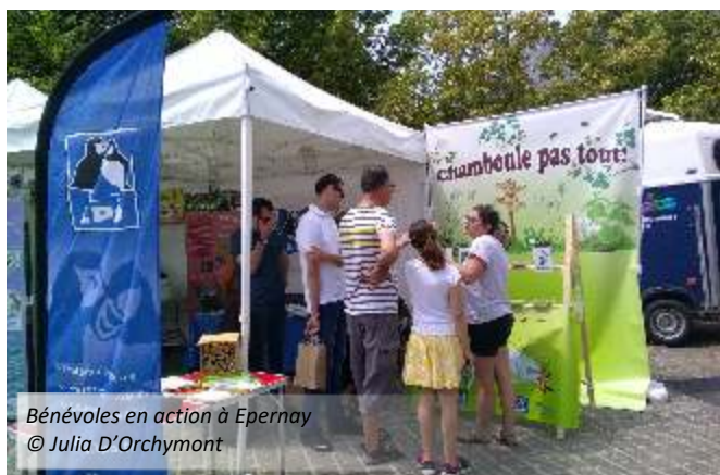
Bénévoles en action à Epernay

les cantons de Dormans et d'Épernay lors de l'enquête Corbeau freux.