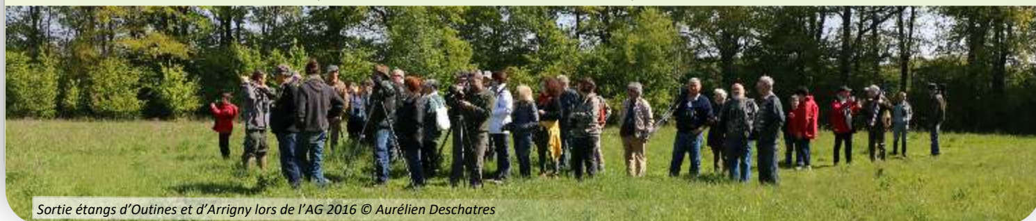
Sortie étangs d'Outines et d'Arrigny lors de l'AG 2016