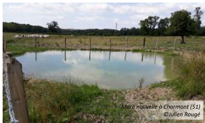
Mare nouvelle à Charmont (51)

Par la suite, ces mares devront être suivies pour vérifier leur bon fonctionnement ainsi que leur colonisation naturelle par la faune et la flore.