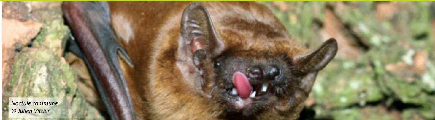
Noctule commune