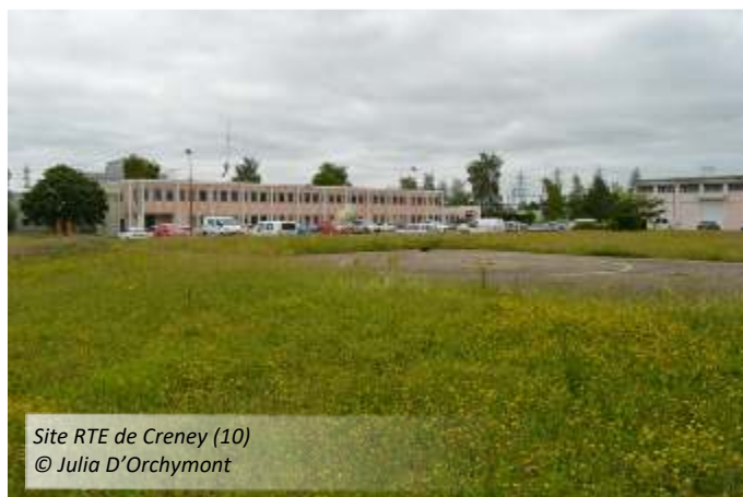
Site RTE de Creney (10)

RTE (Réseau de Transport de l'Electricité) a réalisé le déplacement et le renforcement d'une ligne électrique haute tension au nord du lac du Der (région du Perthois). En amont des travaux, des rencontres ont eu lieu avec la LPO afin de déterminer les différentes options de tracés. Le secteur concerné est en effet une zone d'alimentation quotidienne des grues mais aussi de passages migratoires. Une fois la ligne installée, des balises anti-collision ont été placées sur les câbles aux endroits jugés les plus à risques. Un suivi de terrain entre octobre et février a permis de retrouver 8 cadavres ou plumées sous la ligne. Par temps de fort brouillard, la présence de balises ne semble malheureusement pas diminuer les risques.