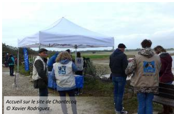
Accueil sur le site de Chantecoq

Ce rendez-vous dominical, soutenu par Seine Grands Lacs (organisme qui gère le lac du Der), a permis de rencontrer au moins 2 266 personnes au cours de 13 après-midi. Soit 132 heures de bénévolat cumulées, pour les 39 bénévoles venus assurer l'animation de ce point d'accueil et d'information. Certains bénévoles apprécient ces moments d'échange avec le public et reviennent plusieurs fois au cours de la saison.