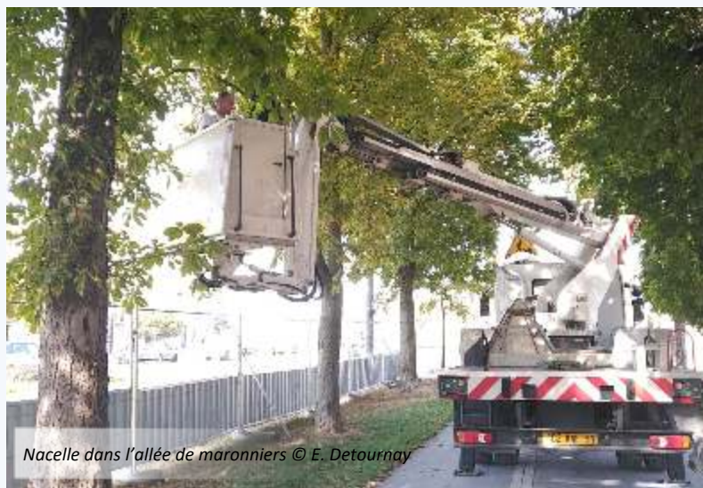
Nacelle dans l'allée de marronniers