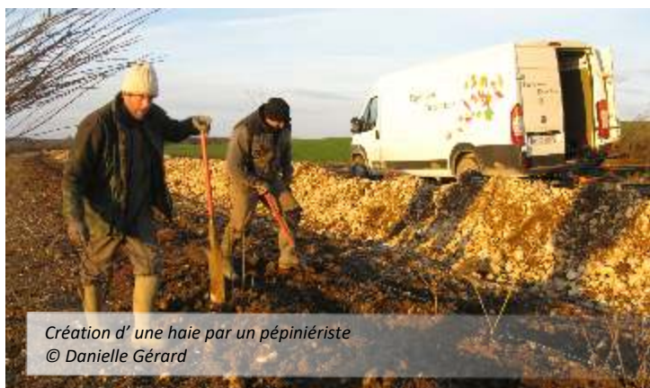
Création d'une haie par un pépiniériste

Les 3 communes de Warnécourt (08), Serzy-et-Prin (51) et Champignol-lez-Mondeville (10) bénéficient, après un long travail de préparation, de la mise en place d'aménagements en faveur de la biodiversité : plantations de plusieurs kilomètres de haies, de centaines d'arbres fruitiers, de réouverture de pelouses sèches, de création ou restauration de mares... Ces réalisations concrètes sont possibles grâce aux financements de la Région Grand Est, de la DREAL Grand Est et des agences de l'eau.