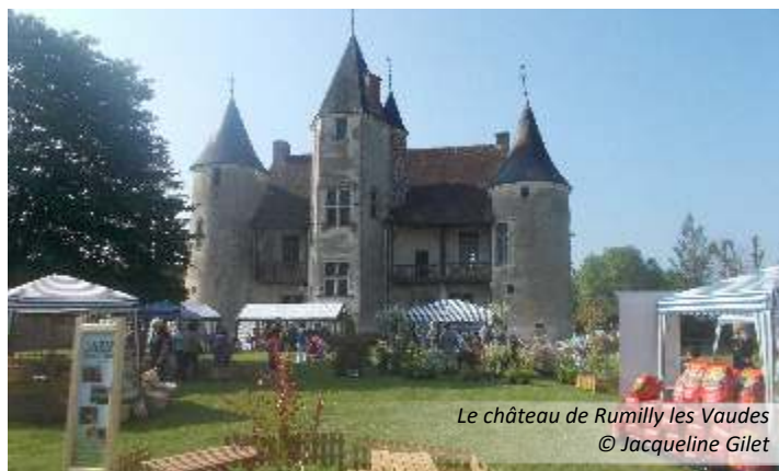
Le château de Rumilly les Vaudes