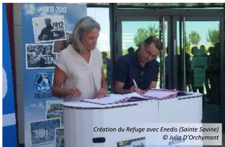
Création du Refuge avec Enedis (Sainte Savine)

En 2018, la Champagne-Ardenne compte 7 Refuges Collectivités, 3 Refuges Entreprises et 13 Refuges Etablissements. Du côté des particuliers, 406 refuges jardins et balcons sont comptabilisés, dont 36 nouveaux refuges en 2018. Ainsi, ce sont plus de 400 ha qui sont dédiés à la nature de proximité.