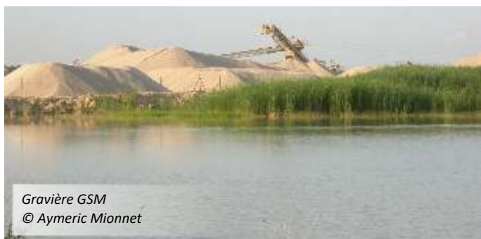
Gravière GSM

A Cheppes-la-Prairie, les effectifs de quelques passereaux prairiaux se reconstituent peu à peu : Bruant proyer, Pipit farlouse, Bergeronnette printanière. A contrario , certaines espèces restent à un niveau très faible : Bruant des roseaux, Alouette des champs. Aucun râle des genêts n'a été entendu cette année.