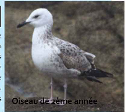
Oiseau de zème année

Espèce orientale, les plus proches nichant en Pologne, le Goéland pontique est un migrateur et un hivernant rare chez nous mais régulier et en augmentation, à mettre en lien avec l'amélioration des critères d'identification dans les récents guides ornithos. La 1 ère mention en France date de 1997 et chez nous en 2000, époque où aucun guide ornithos ne le décrivait. Il est donc longtemps passé inaperçu sur nos grands lacs, d'autant plus que son identification n'est pas si aisée par rapport aux autres goélands.