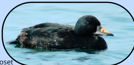
Mâle adulte de Macreuse noire

Espèce monotypique, la Macreuse noire niche de l'Islande à la Sibérie et jusqu'au nord de la Grande-Bretagne et de l'Irlande. Essentiellement maritime, elle hiverne sur les côtes Atlantique, de l'Europe de l'ouest jusqu'à l'Afrique, en Mauritanie. Elle est nettement plus rare à l'intérieur des terres, et se rencontre parfois dans notre région à l'automne, dans la plupart des cas, seule. De temps à autre, elle est observée en hiver et quelques cas d'hivernage ont déjà eu lieu, notamment sur le lac du Der. Si quelques groupes ont pu être notés dans la région (12 en janvier 1983 sur le lac d'Orient, 6 en novembre 1987 sur Bairon, 5 en novembre 1990 sur le Der), la Macreuse noire apparaît quasi exclusivement chez nous à l'unité. Notons que la majorité des observations mentionnent des femelles ou des immatures, les mâles sont clairement plus rares dans la région. La remontée vers ses sites de reproduction s'effectue en mars et avril. Attention à ne pas la confondre avec sa cousine, la Macreuse brune, rare mais un peu plus régulière en Champagne-Ardenne. La Macreuse brune est reconnaissable, entre autres, à ses miroirs blancs sur les ailes, que ne possède pas la noire, dont les ailes sont entièrement sombres.