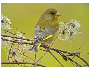
Verdier d'Europe

A l'initiative du Réseau LPO, un grand comptage hivernal des oiseaux des jardins est, à nouveau, organisé les 25 et 26 janvier prochains. Ce comptage a pour but d'évaluer la richesse écologique des jardins et d'effectuer un suivi des populations d'oiseaux communs des jardins.