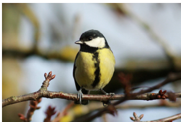
Mésange charbonnière