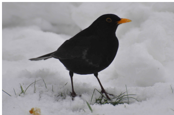
Merle noir