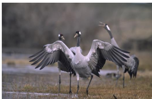
Grues cendrées