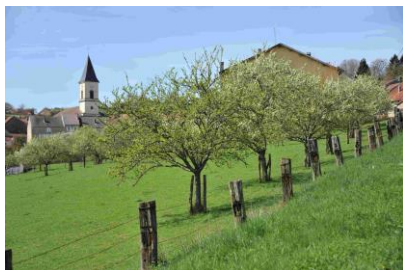
Verger en Haute-Marne

Dans le cadre de la 34 ème édition des journées européennes du Patrimoine, la LPO a souhaité proposer deux actions ayant trait au patrimoine commun et accessible à tous : notre patrimoine naturel.