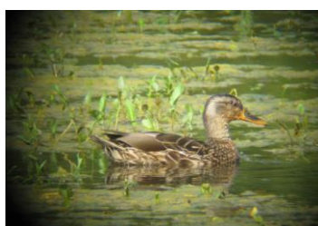
Canard colvert femelle