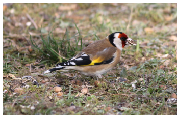
Chardonneret élégant