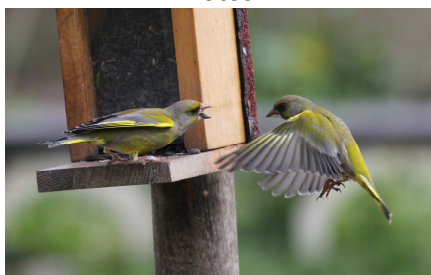
Verdier d'Europe