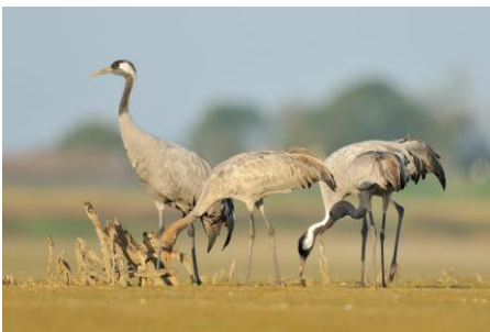
Grues cendrées