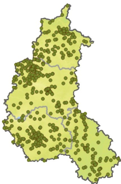
Répartition des jardins recensés lors des précédents comptages