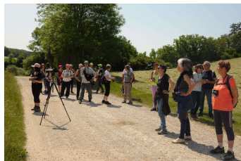
Sortie antérieure à Brottes

Contact pour cette sortie : glchaumont52lpo@gmail.com ou 06-62-20-69-99